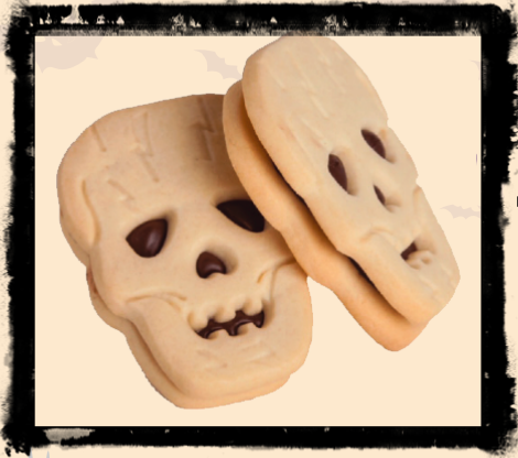
Teschio al cioccolato

SCOPRI LA SELEZIONE DEI NOSTRI PRODOTTI MOSTRUOSAMENTE BUONI!