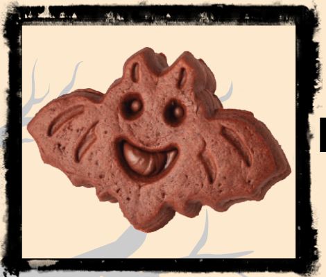
Pipistrello al cioccolato