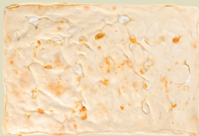
SANTA MARGHERITA CON STRACCHINO